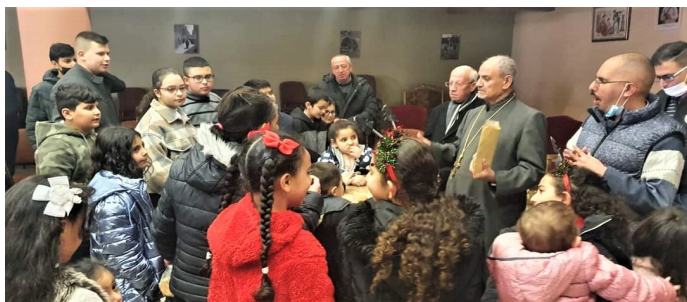
Distribution de cadeaux de Noël offerts grâce aux dons envoyés par Avenir Jeunes Bethléem

« Comment allez-vous ? Cette année a été bien difficile mais en cette veille de Noël, nous espérons que vous passerez de belles fêtes de Noël et nous gardons le regard fixé sur Jésus. (...) L'aéroport est de nouveau fermé et tous ceux qui voulaient se rendre à Bethléem pour Noël et que nous attendions de tout cœur, ont dû annuler leur voyage. C'est une grande épreuve pour nous et nous portons dans la prière tous ceux qui auraient voulu venir célébrer la nativité avec nous. Nous espérons qu'en mars, les frontières s'ouvriront enfin et que la vie reprendra. »